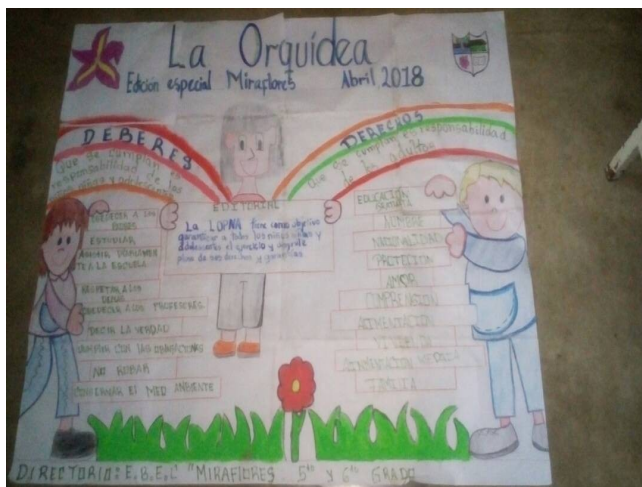
Redactor de Noticia: Lcda. Yusbelis Flores.