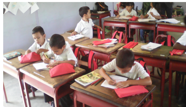
Redactor de Noticia: Lcda Liliana Neira.

Las y los estudiantes de las diferentes instituciones del Núcleo Escolar Rural Número 609, desarrollan actividades académicas con el uso de la colección bicentenario.