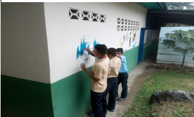
Redactor de Noticia: Lcda. Yusbelis Flores.