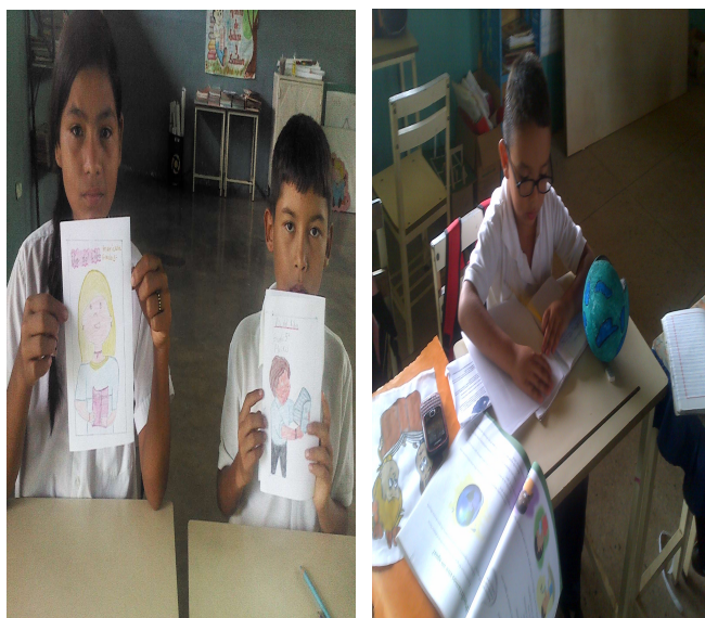
Redactor de Noticia: Lcda. Yusbelis Flores.

En las diferentes instituciones que conforman el Núcleo Escolar Rural N° 609 se llevaron a cabo unas series de actividades para la celebración de la semana del libro y del idioma, tales como: elaboración de periódicos mural, cuentos imaginarios, adivinanzas, poemas, cuentos, retahílas, escritos relacionados a las efemérides contando con la participación con los estudiantes y docentes de las diferentes instituciones que conforman el Núcleo Escolar Rural N° 609