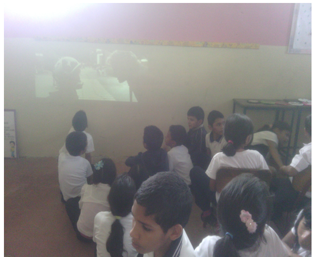
Redactor de noticia: Lcda. Liliana Neira.