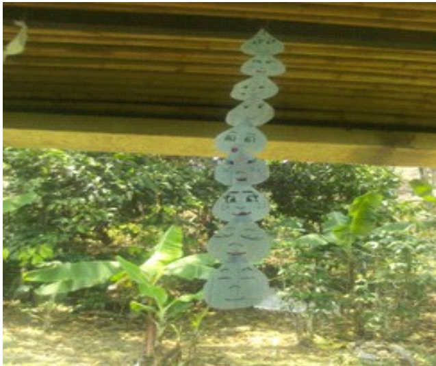
Redactor de Noticia: Lcda Edilia Valdés