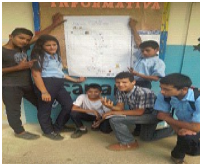
Redactor de Noticia: Lcda Noraima Montilla.