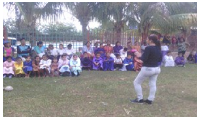
Redactor de Noticia:Ysbeliz Colina.