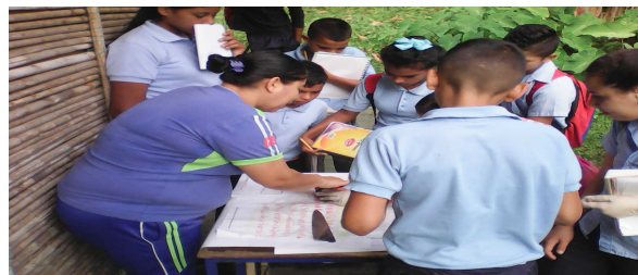
Redactor de Noticia: Lcda Corina Sayago.