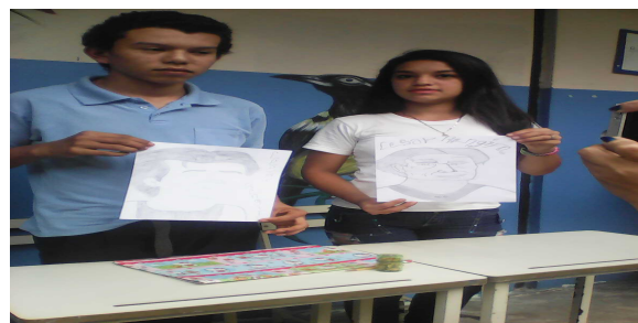
Redactor de Noticia: Msc. Ysbeliz Colina