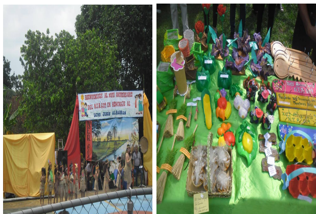
Redactor de Noticia: Lcda Adelina Briceño

Actividades culturales, musicales, improvisaciones, representaciones teatrales amenizaron este gran encuentro, así como también se expusieron los trabajos realizados por los estudiantes, docentes, obreros, madres cocineras cada quien aportó su granito de arena para hacer de este evento una gran celebración.