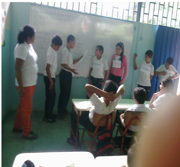
Redactor de Noticia: Elvis Angarita (Estudiante)