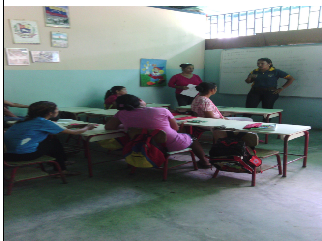
Fotógrafo: Msc. Liliana Neira. Redactor de Noticia: Msc Yusbelis Flores.