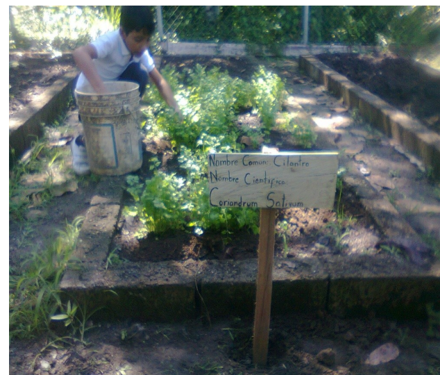
Redactor de noticia: Caryelit González (Estudiante)