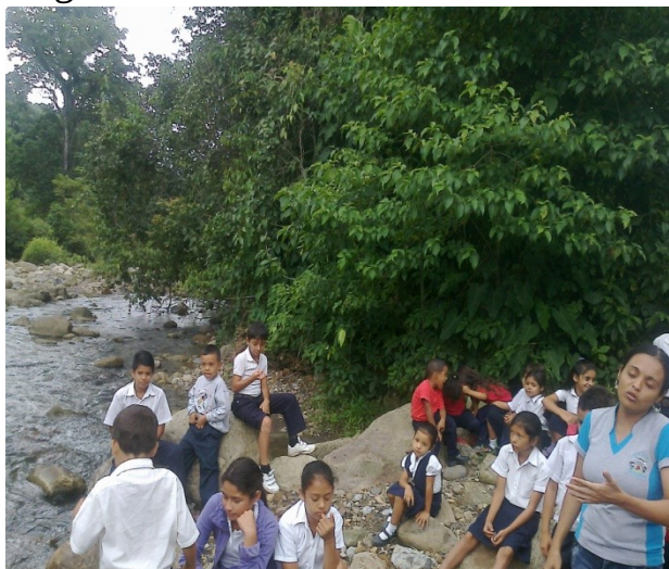
Redactor de Noticia: Lcda. Alexandra Salas

El 13/10/2016 se realizó una caminata ecológica con los niños y niñas de la Escuela Básica Estadal Concentrada “Las Doradas” en junto con las docentes, la caminata ecológica fue hacia las orillas del Río Juan Grande, se realizó un conservatorio para promover la importancia y la conservación del agua.