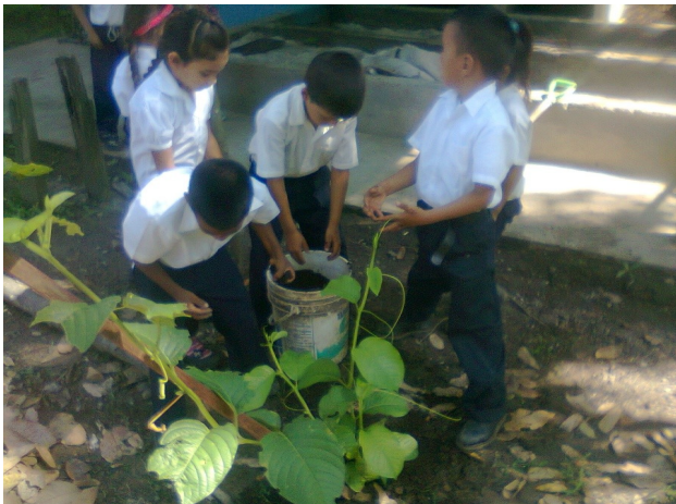
Redactor de noticia: Elvis Rios (Estudiante)

El lunes 21 de octubre del presente año en la Escuela Básica Estadal Concentrada “Las Doradas” se realizó la recolección de abono orgánico en el compost de la institución, mediante la participación de los niños(as) del primer y segundo grado en conjunto con el profesor Lcdo Leonardo Bastidas docente en función Agricultura y docentes de Aula con la finalidad de ser aplicado en el compost, para avanzar el crecimiento y desarrollo de las plantas de parcha badea, cebollín , aji dulce y cilantro en el huerto escolar de la Institución.